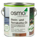
Stein- und Terrakotta-Öl

Dadurch, dass das Imprägnier-Öl frei von bioziden Wirkstoffen ist, kann es auch unbedenklich im Bereich von Lebensmitteln verwendet werden, z.B. bei Stein von Grills.